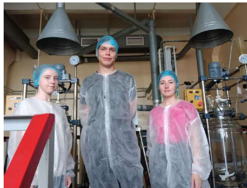
Фото практикантів на дільниці хімічного виробництва органічних продуктів.