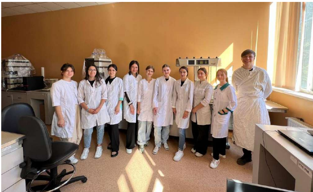
Група практикантів в лабораторії Державної служби України з лікарських засобів та контролю за наркотиками.

Під час проходження практики практиканти ознайомились з основними завданнями Держлікслужби, а саме: