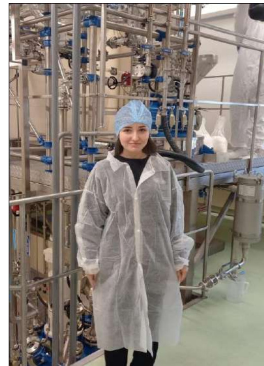
Фото практикантів на дільниці виробництва активних фармацевтичних інгредієнтів.